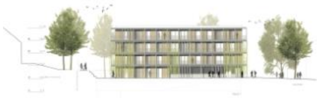
Ansicht von Westen (Jahnstraße) (ohne Maßstab)

Der Gemeinderat der Stadt Filderstadt hat am 06. März beschlossen, dass die Bietergemeinschaft Bodamer Faber Architekten/FWD Hausbau und Grundstücks GmbH*) den 1. Platz im Investoren- und Planungswettbewerb des Wohnquartiers Jahnareal belegt und den Grundstückszuschlag erhält. Das Grundstück wird im Erbbaurecht vergeben.